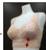
苦労された着丈設定